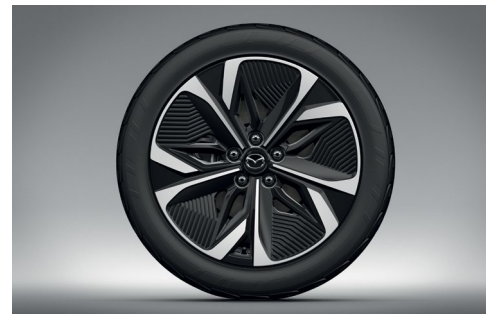
Jantes alliage 19" « Black Silver Aerodynamic » (245/45R19 Michelin)