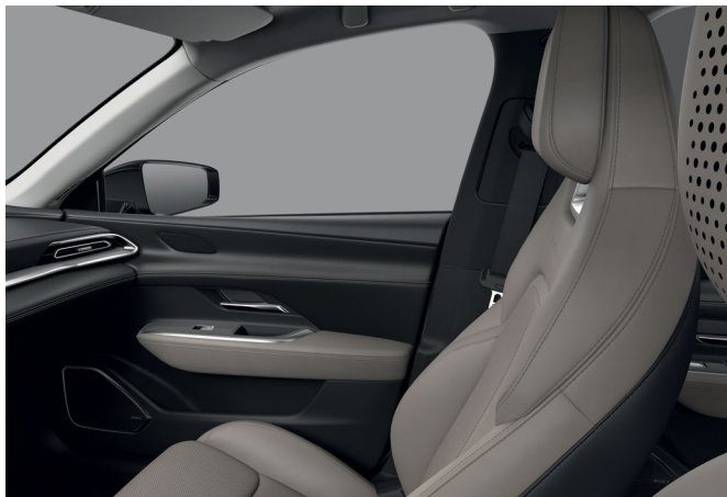
Sellerie synthétique « Beige »