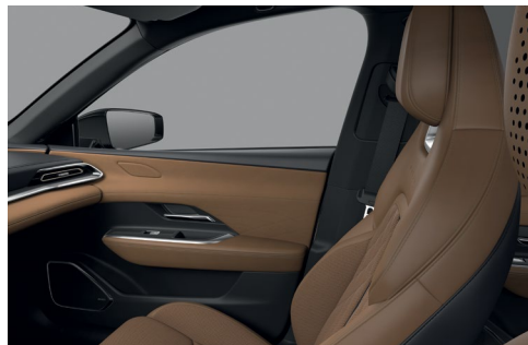
Sellerie cuir Nappa Tan et suédine*