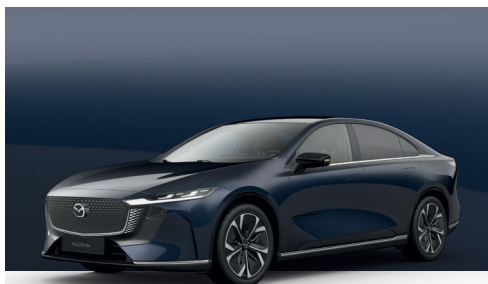
DEEP CRYSTAL BLUE | 750 €