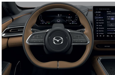
Volant gainé de cuir bi-ton