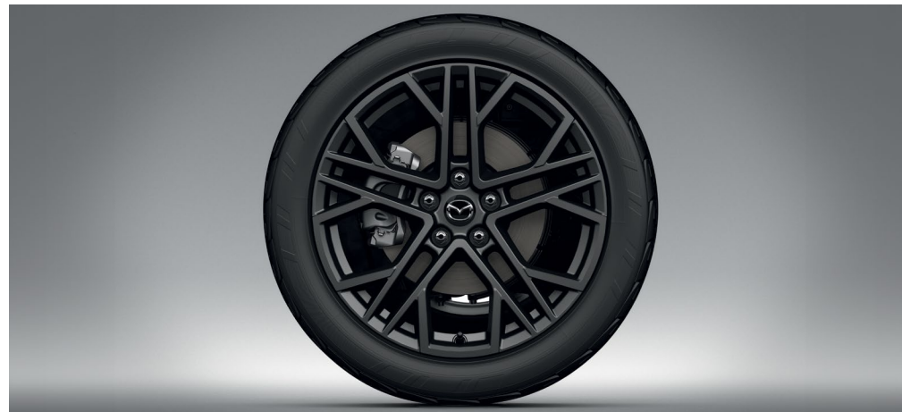
JANTES ALLIAGE 19" « ANTHRACITE BRILLANT »