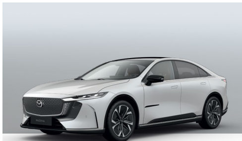
CRYSTAL WHITE PEARL | 0 €