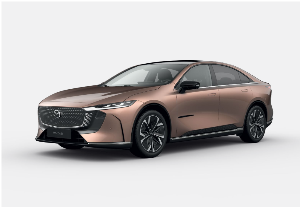
Mazda6e Takumi avec option peinture Melting Copper

Disponible en motorisations électriques 245ch et 258ch