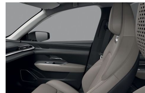
Sellerie synthétique « Beige »