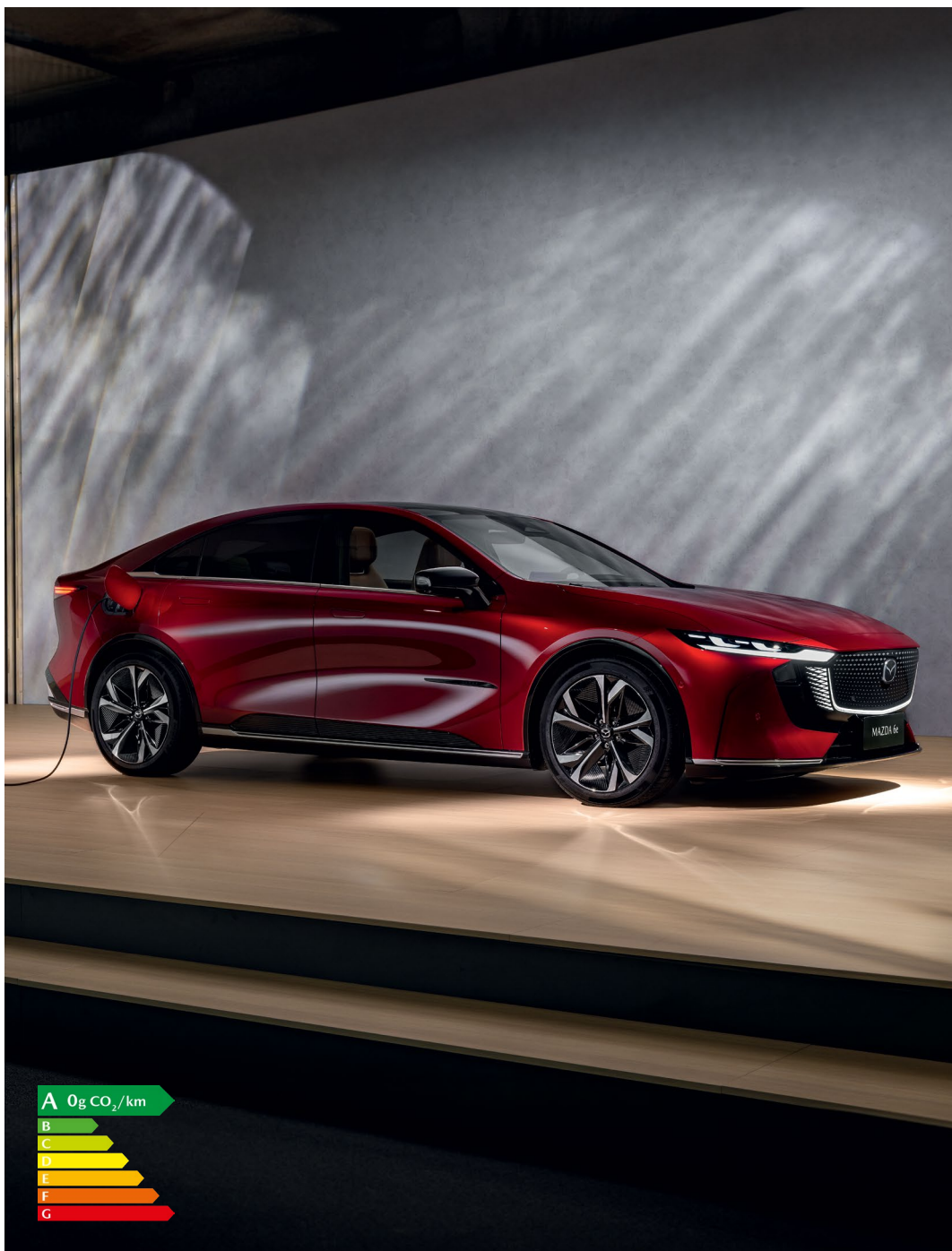
Mazda6e Takumi Plus avec option peinture Soul Red Crystal