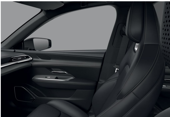
Sellerie synthétique « Noir »