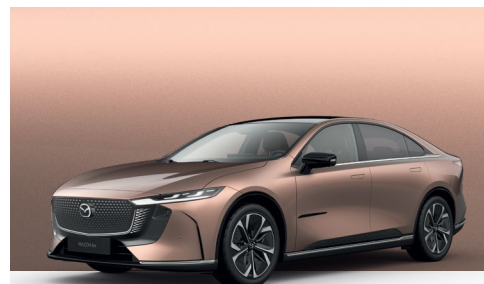
MELTING COPPER | 750 €