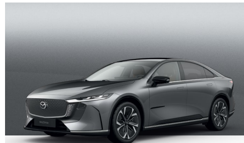
MACHINE GREY | 900 €