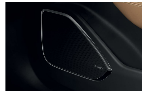
Système audio avec radio FM/DAB et 14 haut-parleurs Sony™