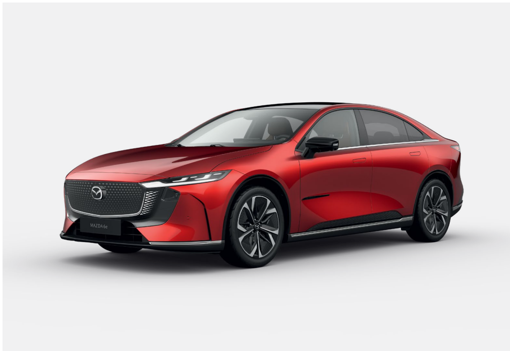
Mazda6e Takumi Plus avec option peinture Soul Red Crystal

Disponible en motorisations électriques 245ch et 258ch