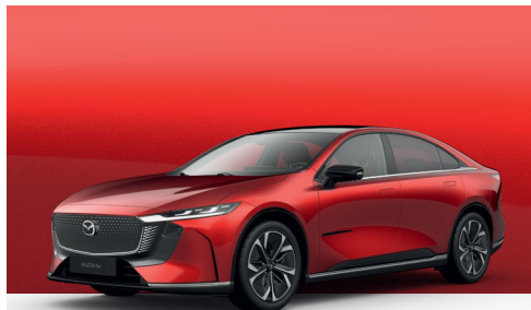
SOUL RED CRYSTAL | 1 050 €