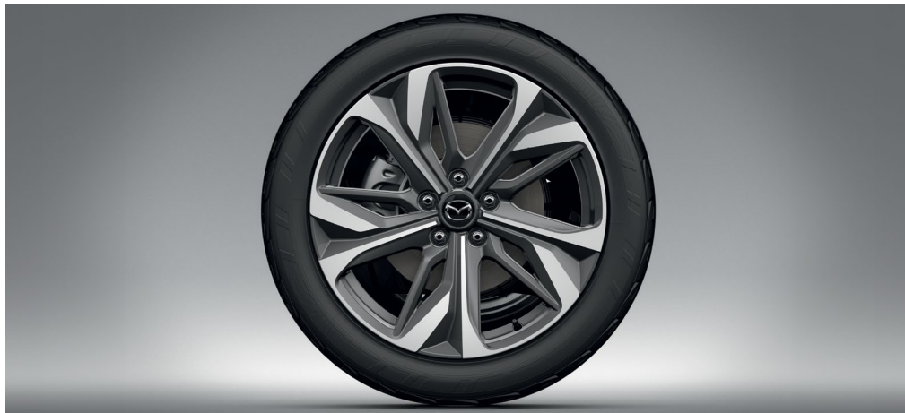
JANTES ALLIAGE 19" « Design 180 »