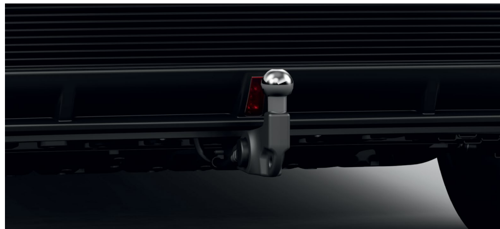
ATTELAGE RÉTRACTABLE, ÉLECTRIQUE, AVEC FAISCEAU D'ATTELAGE