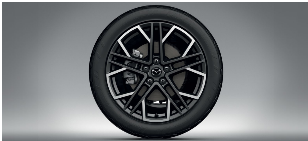
JANTES ALLIAGE 19" « DIAMOND CUT »