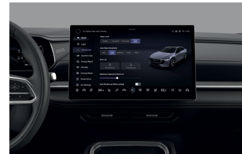
Ecran central avec système d'infodivertissement 14,6"