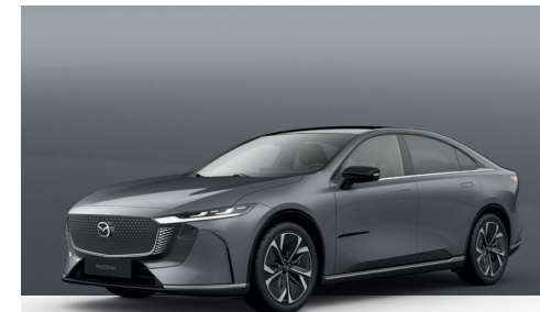
POLYMETAL GREY | 750 €