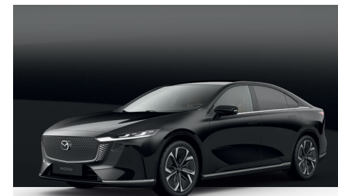
JET BLACK | 750 €

Utilisez notre configurateur pour trouver la Mazda6e qui vous convient.