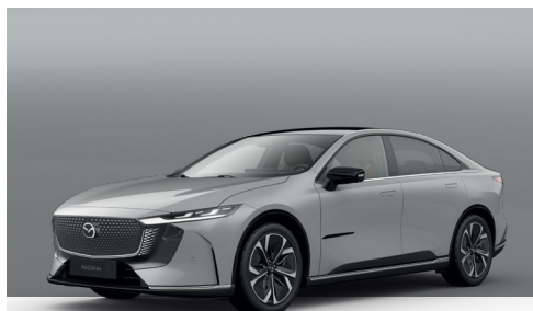
AERO GREY | 750 €