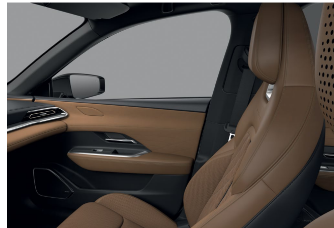
Sellerie cuir Nappa Tan et suédine*

* Seules les zones portantes des sièges (assise, dossier, renforts latéraux) sont revêtues des garnitures mentionnées.